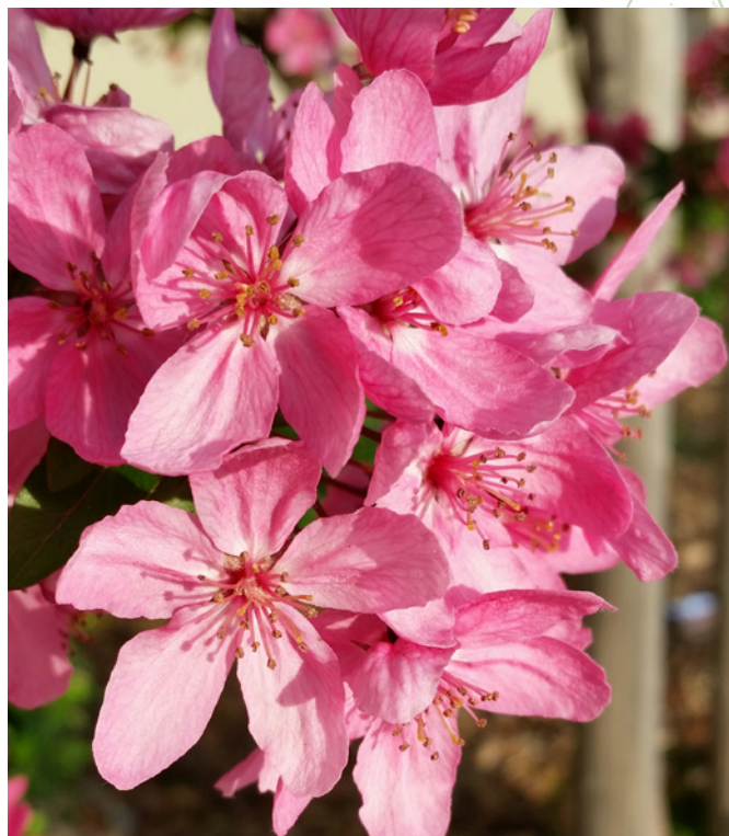
Foto: Azaléia, uma das flores símbolo da cidade de São Paulo.

Mais do que uma celebração, o seminário consolidou-se como um espaço estratégico de reflexão sobre o presente e o futuro do abastecimento. Ao longo dos dois dias, os painéis trouxeram discussões de alto nível sobre temas centrais para o setor.